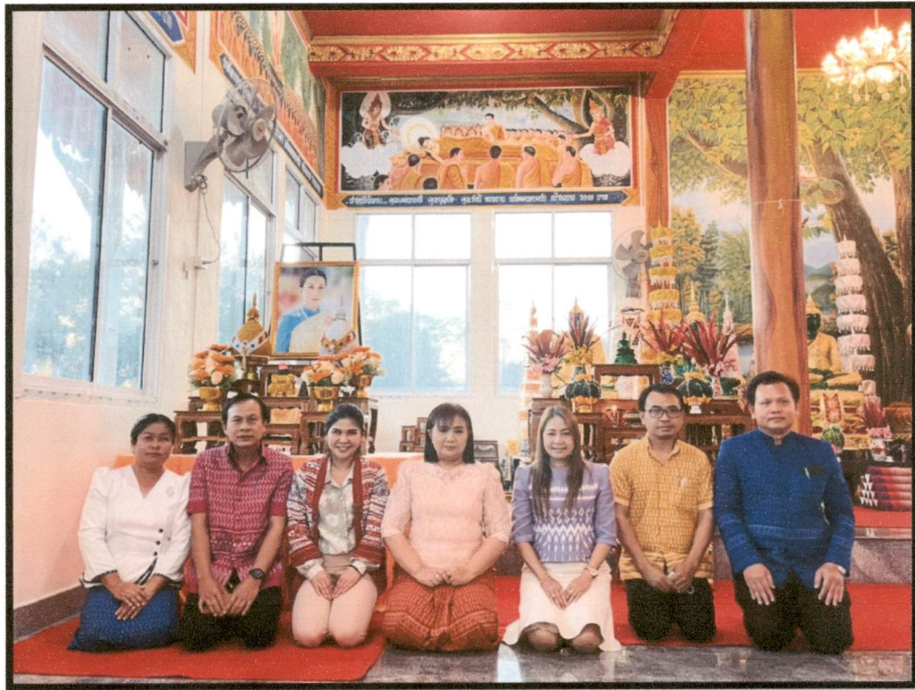
กิจกรรมที่ ๓.การจัดกิจกรรมทำบุญ ถวายเครื่องไทยธรรม และบำเพ็ญประโยชน์ ณ วัดต่าง ๆ เจ้าหน้าที่สำนักงานสาธารณสุขอำเภอชุมแพ มีกิจกรรมร่วมทำบุญ และกิจกรรมที่เป็นประโยชน์ต่อสาธารณะ อยู่เสมอ